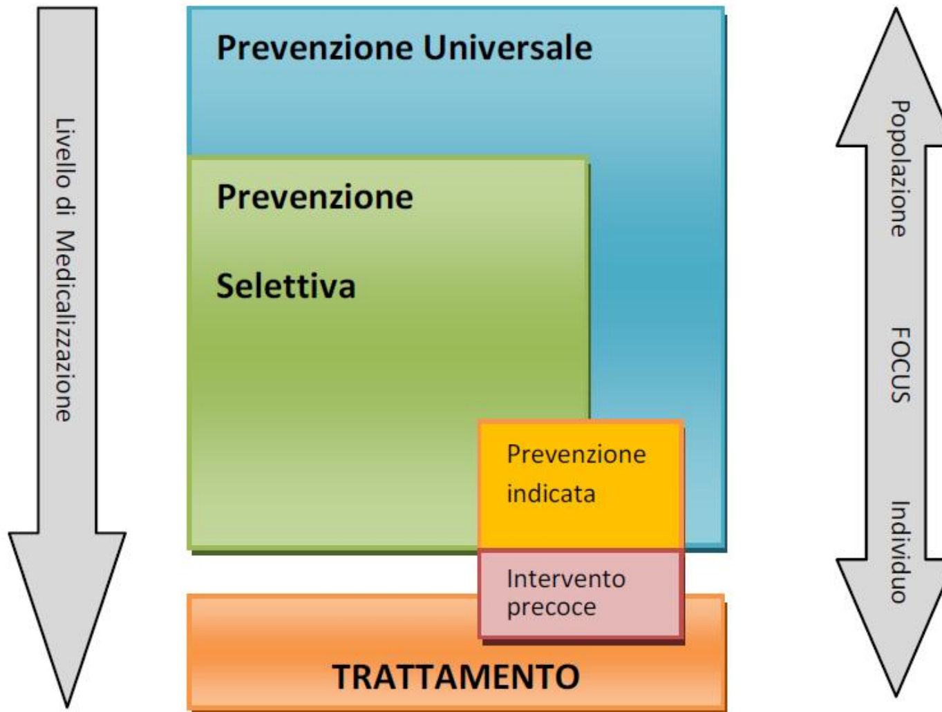
Fig. 1.5 Il continuum USIP-trattamento